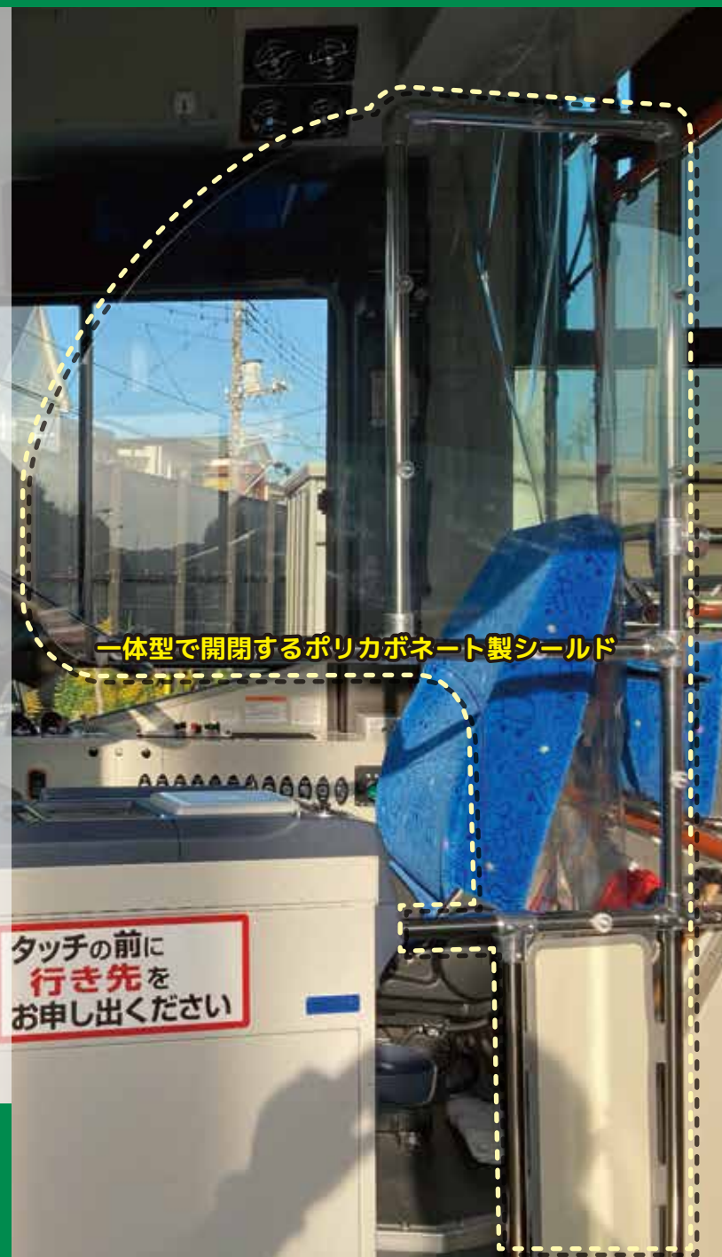
一体型で開閉するポリカボネート製シールド